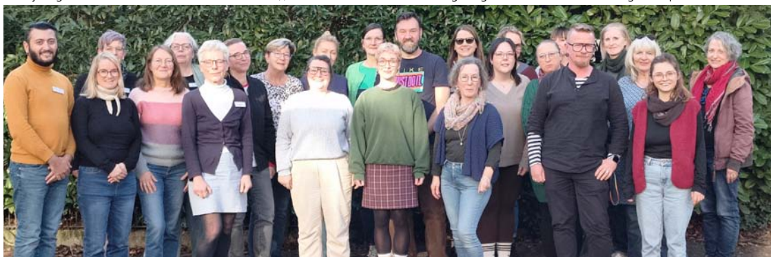
Das Hospiz-Team 2026