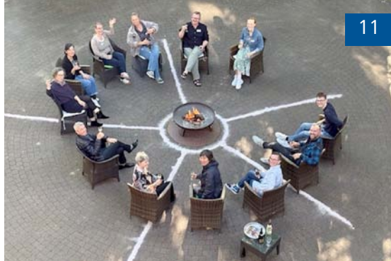
Gedenkfeier für Angehörige mit Ehrenamtlichen