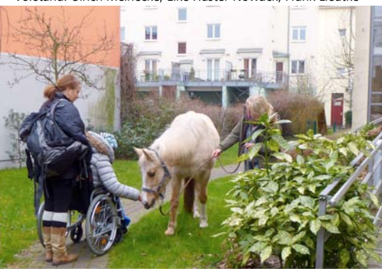
Besonderer Besuch im Hospizhinterhof