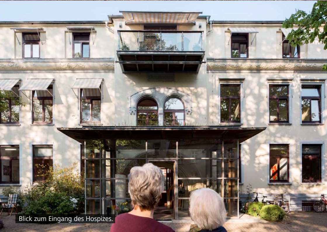
Blick zum Eingang des Hospizes.