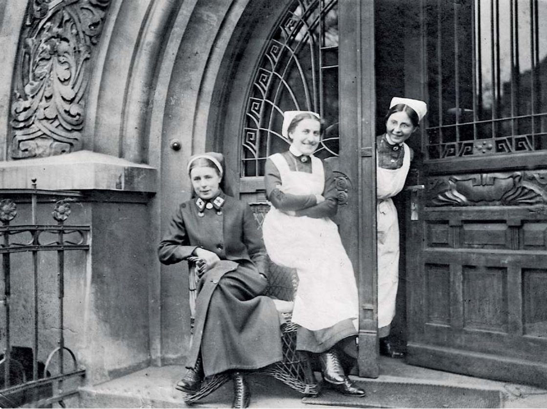
Krankenschwestern vor dem früheren Eingang des Helenenstifts zu Beginn des 20. Jahrhunderts.

Vor Übernahme durch das Hamburger Hospiz im Helenenstift 2001 wurde das Gebäude umfassend modernisiert, der Eingang neugestaltet und mit einem Fahrstuhl versehen (Architekt Martin Reichardt). Eine Vergrößerung der Gästezimmer des Hospizes erfolgte 2022 mit einem Anbau am Helenenstiege (Architekt Joachim Reinig). Die Gebäude rund um das Helenenstift stehen unter Denkmalschutz. Das Viertel, in dem sich das Helenenstift befindet, ist durch eine Soziale Erhaltungsverordnung geschützt.