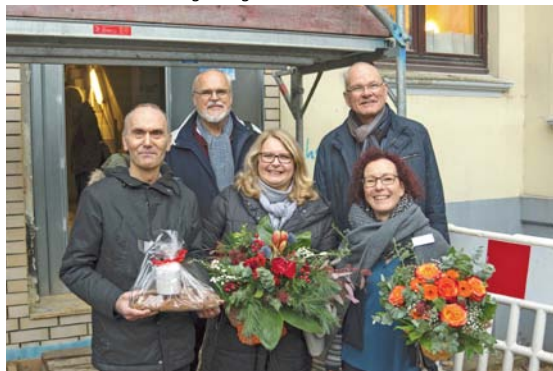
Vorstand und Leitung beim Richtfest des Anbaus 2021