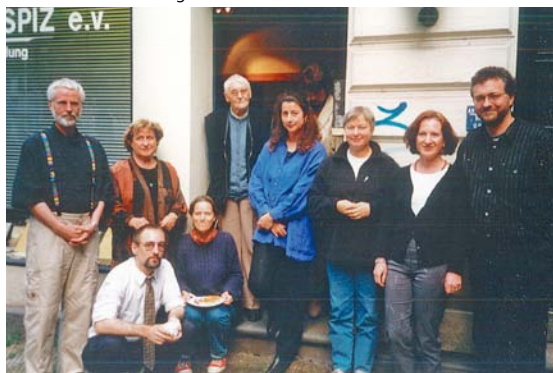
Gründungsmitglieder des Vereins Hamburger Hospiz e.V. 1999