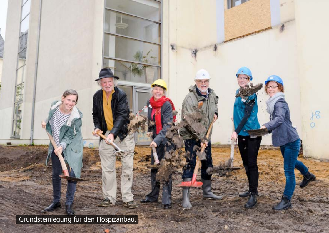
Grundsteinlegung für den Hospizanbau.