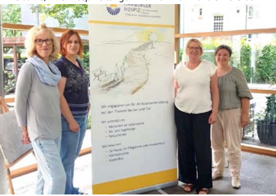
Das aktuelle Team des Ambulanten Hospizberatungsdienstes