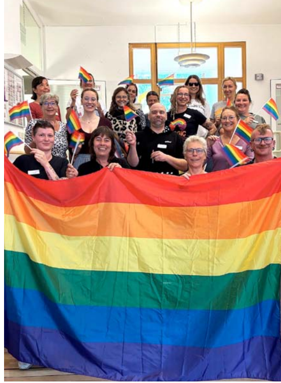
Flagge zeigen für Diversität