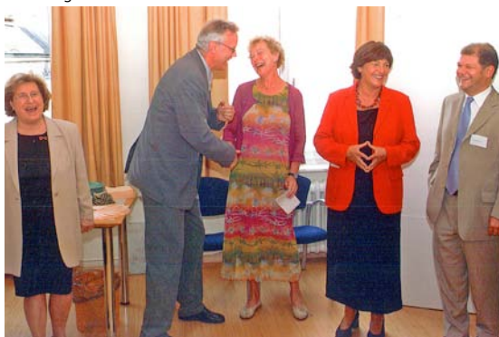
Zehnjähriges Jubiläum mit Ministerin Ulla Schmidt (r) und Olaf Scholz