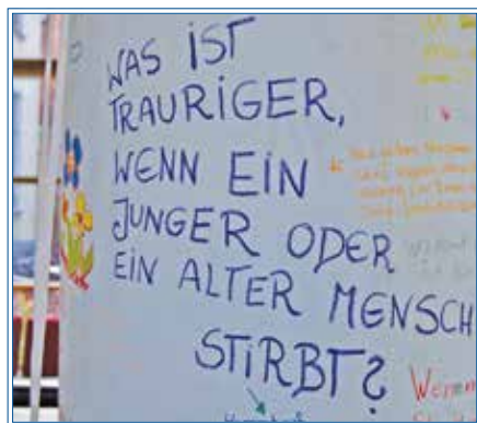
Litfaßsäule: Im Hamburger Hospiz denken auch Kinder über Trauer nach

pen oder Trauer-Cafés aufsuchen. Spaziergänge, Kochen, Malen, Radeln und Reisen für Trauernde können ebenso hilfreich und tröstlich sein. Viele dieser Angebote sind kostenfrei, können für ‚kleines Geld‘ oder auf Spendenbasis in Anspruch genommen werden. Insgesamt ist das Angebot also groß, erschwinglich und vielfältig. Und doch haben viele Trauernde kaum die Kraft, sich auf eine lange Suche nach dem passenden Angebot zu machen oder Wartezeiten für ein Beratungsgespräch oder den Beginn einer Trauergruppe zu überbrücken. Sehr, sehr hilfreich kann also eine wegweisende Beratung sein, die aufzeigt, welche Unterstützungsmöglichkeiten in gut erreichbarer Nähe sofort zur Verfügung stehen.