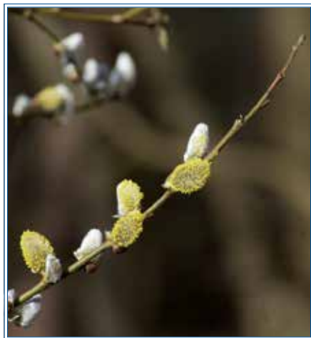
Erste Blüten in der Frühlingssonne

Wie zeitlos sitze ich still an seinem Bett und halte seine Hand. Ich staune, wie schnell er sich von dieser Welt verabschiedet. Vor drei Tagen haben wir noch Backgammon gespielt. Der Tod ist geheimnisvoll. Nach einer Weile spreche ich seine Lieblingspsalmen und erzähle ihm, dass er nun nach