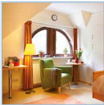
Zu Gast bei Herrn L.

„Herr L., tut mir leid: Leider haben wir keinen Vanillezucker mehr für den Grießbrei.“ „Moment!“, er hantelt sich zum Nachttisch, öffnet die Schublade ... greift tief rein, schaufelt und kramt. Ein Papiertaschentuch segelt auf den Boden. Ich erspähe Mülltüten, Kugelschreiber und Hamburger Allerlei.