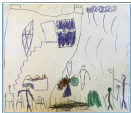
Dustin, 6 Jahre, hat ein Bild gemalt, auf dem es viel zu entdecken gibt.

Nach diesem positiven Echo ist eines klar: Irgendwie muss es nach dem Ende der Ausstellung weitergehen! Heranwachsende brauchen einen unbelasteten Zugang zu den Themen der Endlichkeit. Sie brauchen die