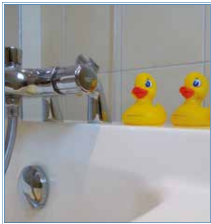
Zeit für Beauty und Wellness

Zwischendurch ein wenig Flirt und Singsang: „Was Süßes für den Süßen?“ Er lacht. „Ist es warm genug?“ „Wenn Sie da sind, ist es heiß genug!“ Nun erröte ich. Es folgt merci und thank you, ein Witzchen hier, ein bisschen Dialekt da... Im Zimmer 309 geht's verbal international zu.