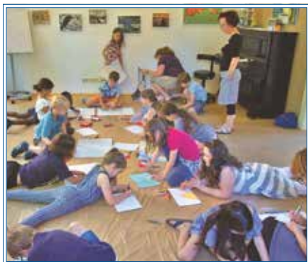
Besuchergruppe beim Malen

Möglichkeit, sich angst- und tabufrei über persönliche Erlebnisse und Fragen auszutauschen. Eine Wiederholung der Ausstellung, vielleicht auch eine Wanderausstellung erscheint uns die passende Antwort auf dieses Bedürfnis. Und an dieser Aufgabe werden wir 2019 weiter arbeiten, versprochen!