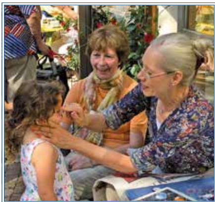
Kinderschminken beim Sommerfest

Eine Besucherin schrieb auf unserer Facebookseite: „Es war ein wundervolles Fest! Die Atmosphäre, die Sonne, das rege Treiben, der Duft von Waffeln und Bratwurst erreichten wirklich jeden drinnen und draußen und erhellten das Wochenende objektiv und subjektiv! Danke dafür!“