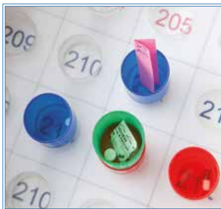
Zu viele Medikamente

Jeder Patient sollte daher seine Medikamente kennen. Oftmals seien nicht die Wirkstoffe für das Auftreten von vorhersagbaren Risiken,