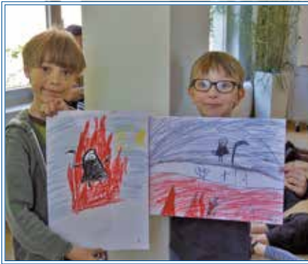
Bilder unserer jungen Ausstellungsbesucher

die erheblichen Herausforderungen, die junge ErzieherInnen meistern müssen, zum Beispiel wenn sie unvorbereitet auf einen akuten Trauerschmerz von Kindern und Jugendlichen reagieren müssen. Auch die hemmungslose Neugier von Kindern zum Thema Tod müssen ErzieherInnen spontan und angemessen beantworten.