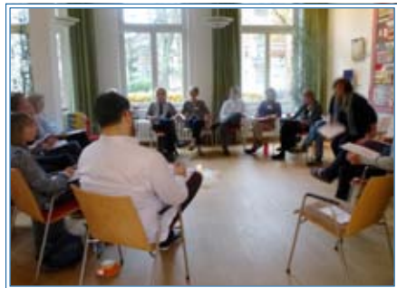
Fortbildung ehrenamtlicher Mitarbeiter

Anlässlich einer Mitarbeiterbefragung wurde es deutlich: Viele ehrenamtliche HospizlerInnen wünschen sich einen Seminartag zum