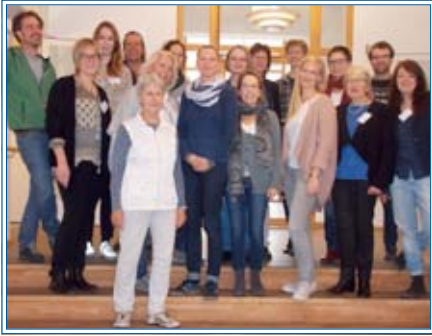
Neue ehrenamtliche Mitarbeiter

keiten kenne ich, Nähe und Distanz zu regulieren? Diese Reise währt bis Ende April. Wir wünschen gutes Gelingen und viel Freude im Ehrenamt!