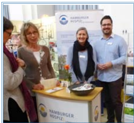
Infostand auf der aktivoli

Eigentlich waren die stationären haupt- und ehrenamtlichen Hospizlerinnen ausgezogen um Bürgerinnen und Bürger für ein Ehrenamt im Hamburger Hospiz e.V. zu begeistern. Doch auch auf der aktivoli, der Messe für das Ehrenamt, am 17.01.2017 in Hamburg zeigte sich, wie hoch das Bedürfnis nach allgemeiner Information und Austausch zum Themenbereich Sterben, Tod und Trauer in der Bevölkerung ist. Ehrenamtlich Interessierte fanden dennoch auch den Weg an den viel besuchten Infostand. Sie wollten sich insbesondere ein Bild davon machen, welche Erfahrungen auf HospizlerInnen zukommen und welche Unterstützung Ehrenamtliche erfahren. Die fleißigen BeraterInnen Met-